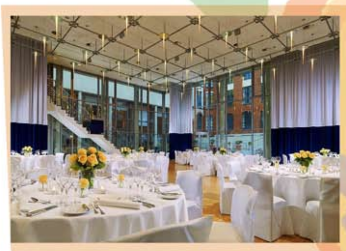
Sheraton Hannover Pelikan Hotel.